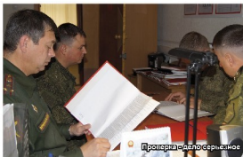
Проверка сделало серьезнее