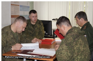
Работа группы в штабе соединения.